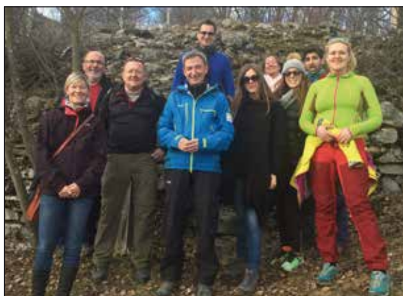
Turoperatører på Pilegrimsleden.

Pilegrimscenteret ser frem til en ny aktiv sesong med variert program og masse besøkende.