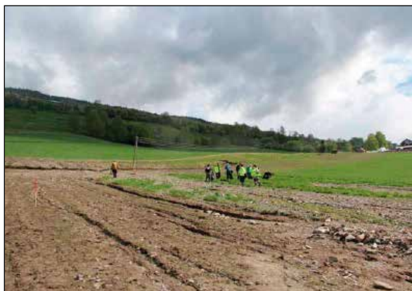
Arkeologer fra Oppland fylkeskommune går mann-gard for å samle inn menneskebein og kranier.

Samarbeidet mellom lokalbefolkningen og kulturminneforvaltningen fungerte meget bra. Rask tilstedeværelse var avgjørende for at vi, på tross av skadene, fikk sikret et viktig kildemateriale og kirkestedet.