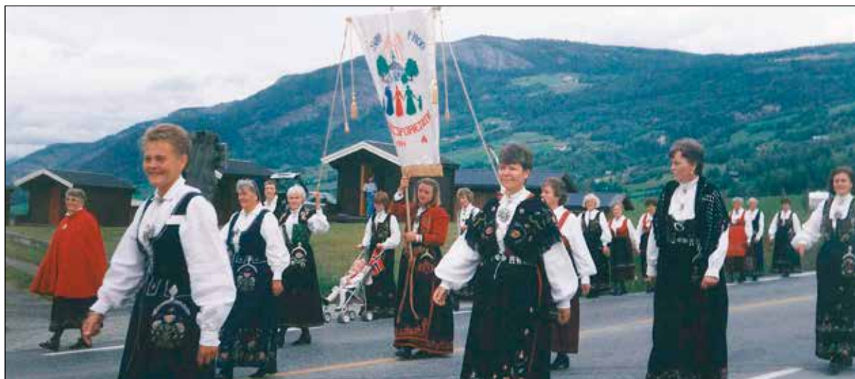
Våre flotte sanitetskvinner i 17. mai tog.