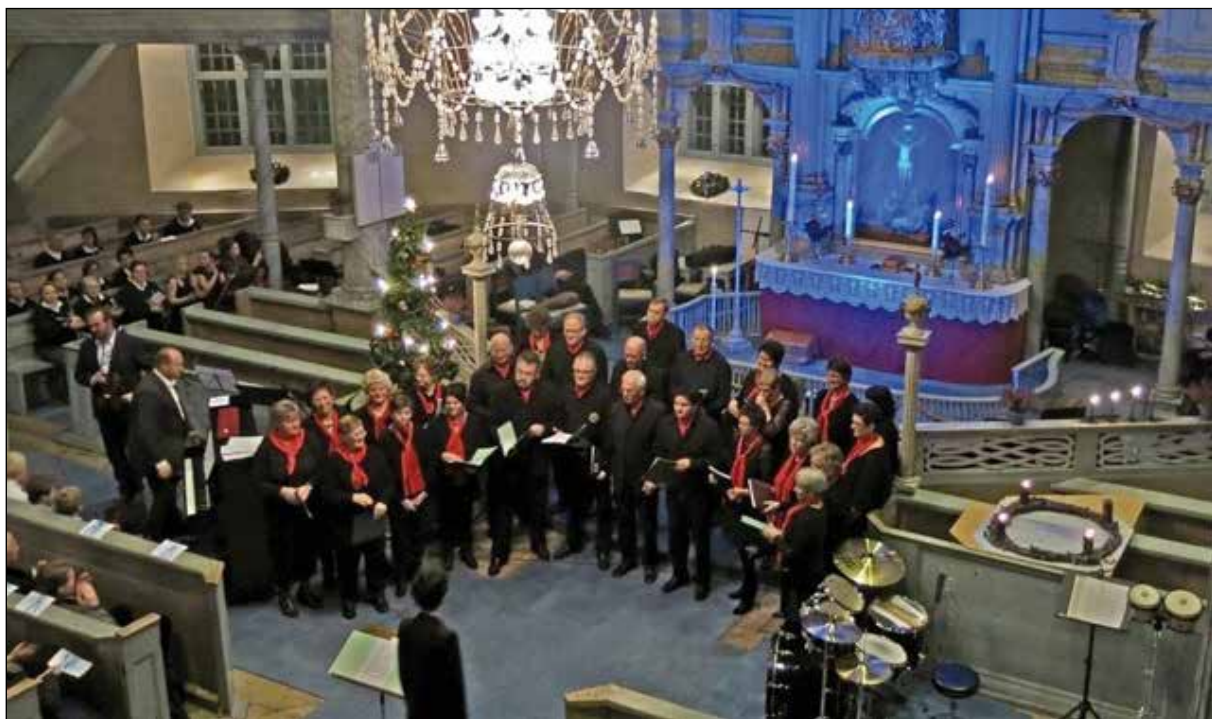
Sør-Fron Sangkor på øvelse foran alteret.