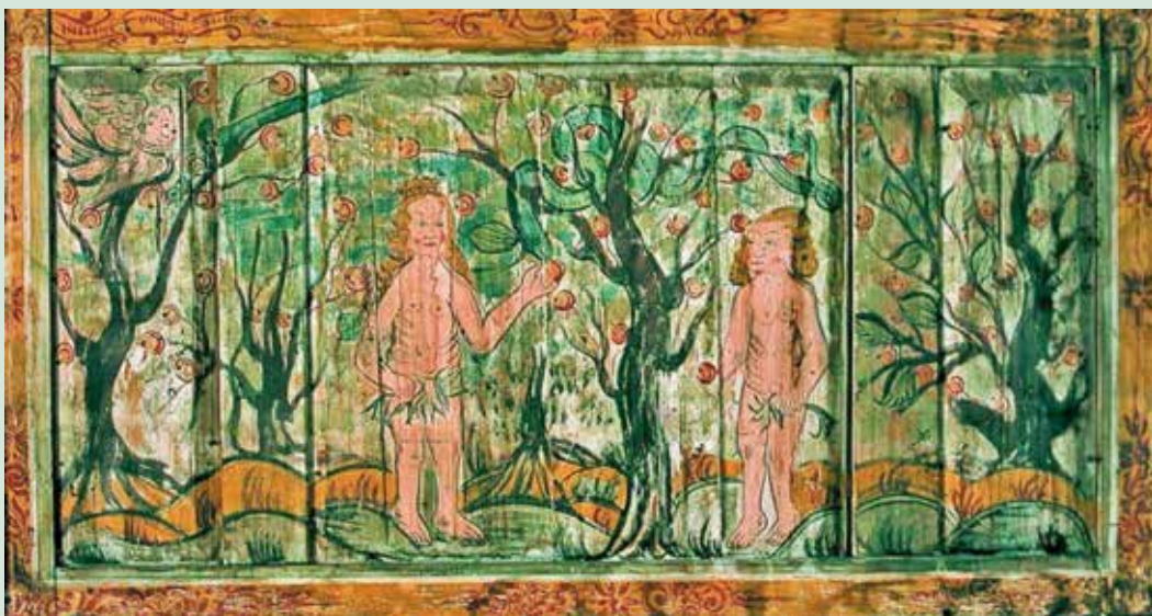
Godt bevart bilde av syndefallet, trolig malt mellom 1680 og 1740. Rollag stavkirke.

Nettopp liv er ordet som ligger til grunn for navnet «Eva». Herren Gud blåser liv i støvet, og slik blir mennesket til en levende skapning. Forestillingen om livet kan imidlertid inneholde ulike dimensjoner: Det kan være både sjel og intellekt, men også mer konkret pust. Samtidig innebærer det at mennesket er en levende skapning, også at det er en trengende skapning; sjelen er stedet der vi lengter etter kjærlighet og fellesskap, og dermed stedet der begjæret vårt etter noe utenfor oss selv har sin plass. I denne lengselen kan det være elementer av både intellektuell forståelse og legemlige behov. Til å være levende hører det å være trengende. Men menneskets oppgave i Edens hage definerer bibelteksten slik at det ble satt der «til å dyrke og passe hagen».