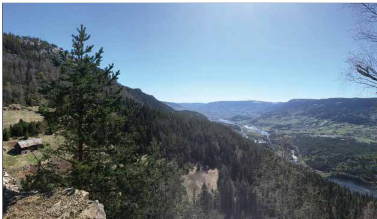
Utsikt Loppet mot Hundorp.

Pilegrimssenteret på Dale-Gudbrand har sammen med soknerådet i Sør-Fron fått på plass