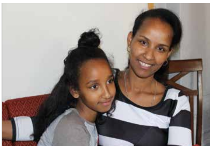
...og glade jenter!