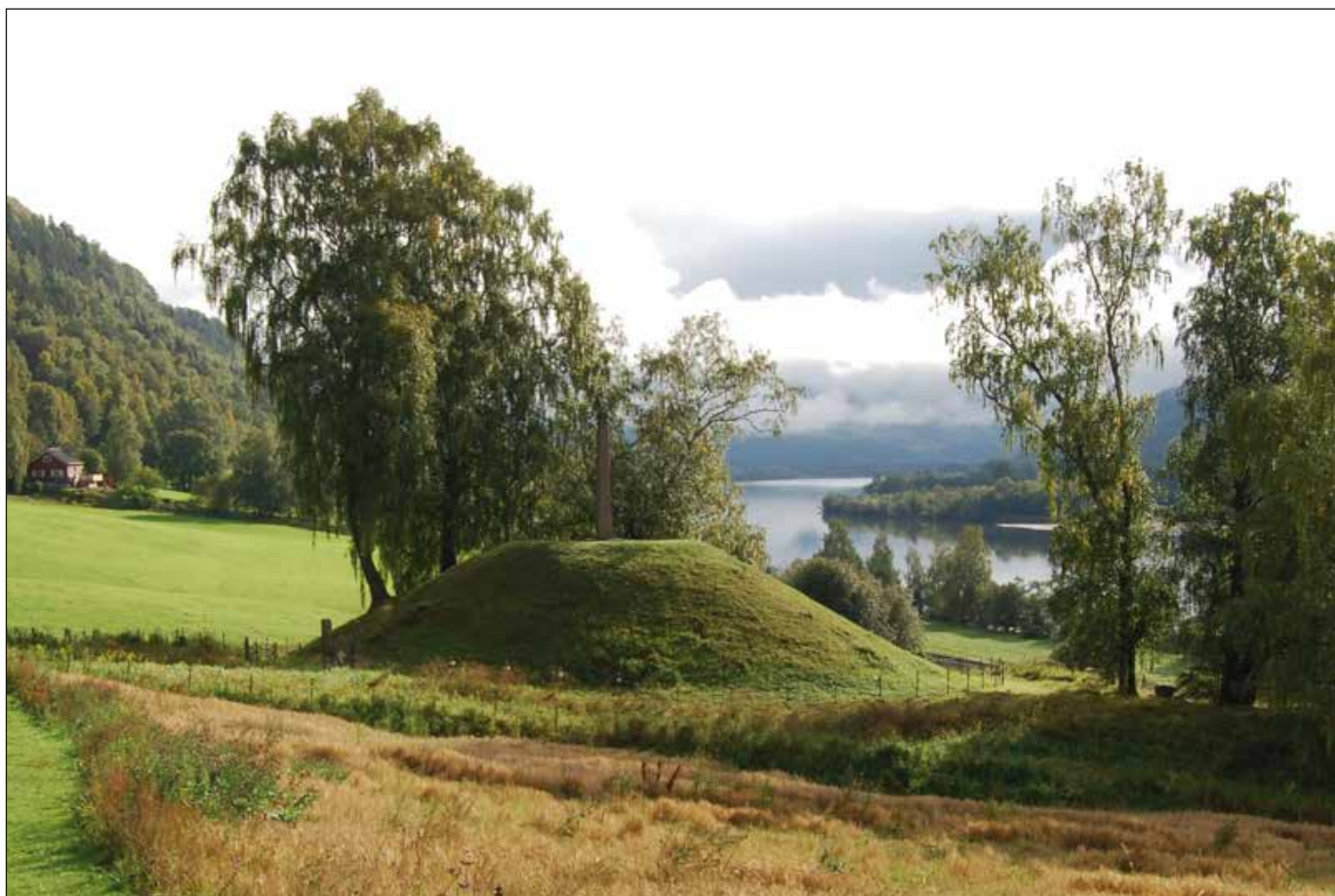
Olavshaugen på Hundorp.

Saken er at Hundorp-episoden ikke har en tøddel av historisk sannhet i seg, bortsett fra de lokale stedsnavnene. Klubbeslaget er fantasy fra ende til annen. Dette var kjent for forskningen fra sogneprest A. Chr. Bangs analyse av teksten i 1879. Men helt frem til 900-årsjubileet på Hundorp i 1921 tok man Snorres fortelling for god fisk som historie. Man mente det var på Hundorp at kongen hadde knust hedendommen. Fortellingen har gjort atskillig skade med hensyn til folks forståelse av før-kristen norrøn religion.