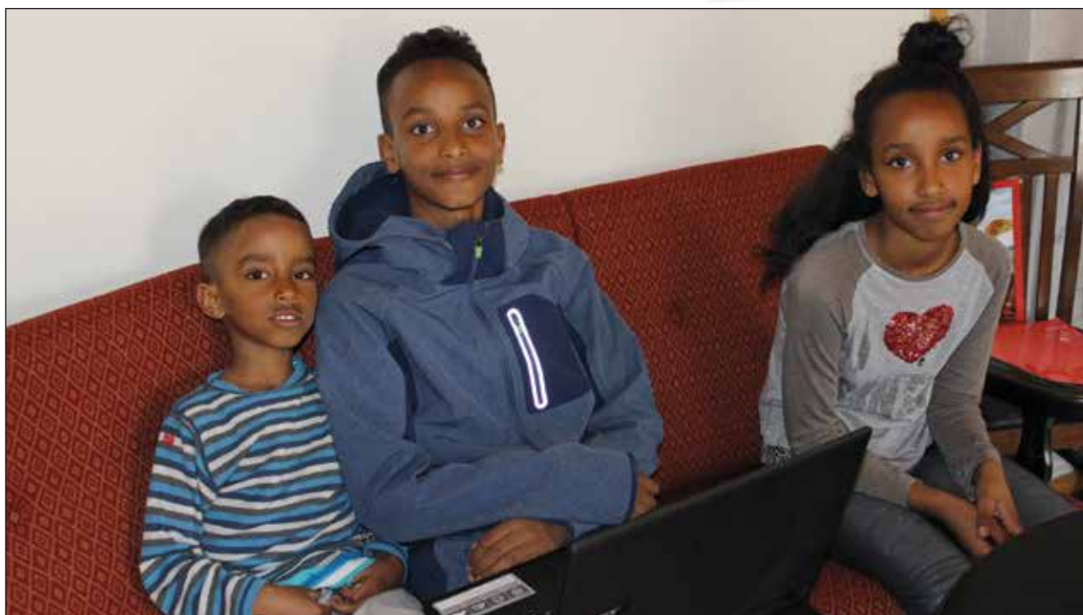
Åpne unger med klare tanker om livet og fremtiden.