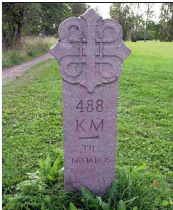
Milsteinen i Hamar som viser hvor langt det er igjen til Trondheim

Pilegrimsleden eller Pilegrimsleia er et fellesnavn på flere turveier, som fører fra forskjellige deler av Norge til Trondheim og enkelte andre hellige steder. Pilegrimsledene i Norge er turveger basert på tradisjonen for å dra på pilegrimsvandring som oppstod etter Olav den Helliges død i 1030, og fortsatte utover middelalderen. Ledene bindes sammen av natur- og kulturminner med religiøs tilknytning til middelalderen, samt minner knyttet til Olavstradisjonen.