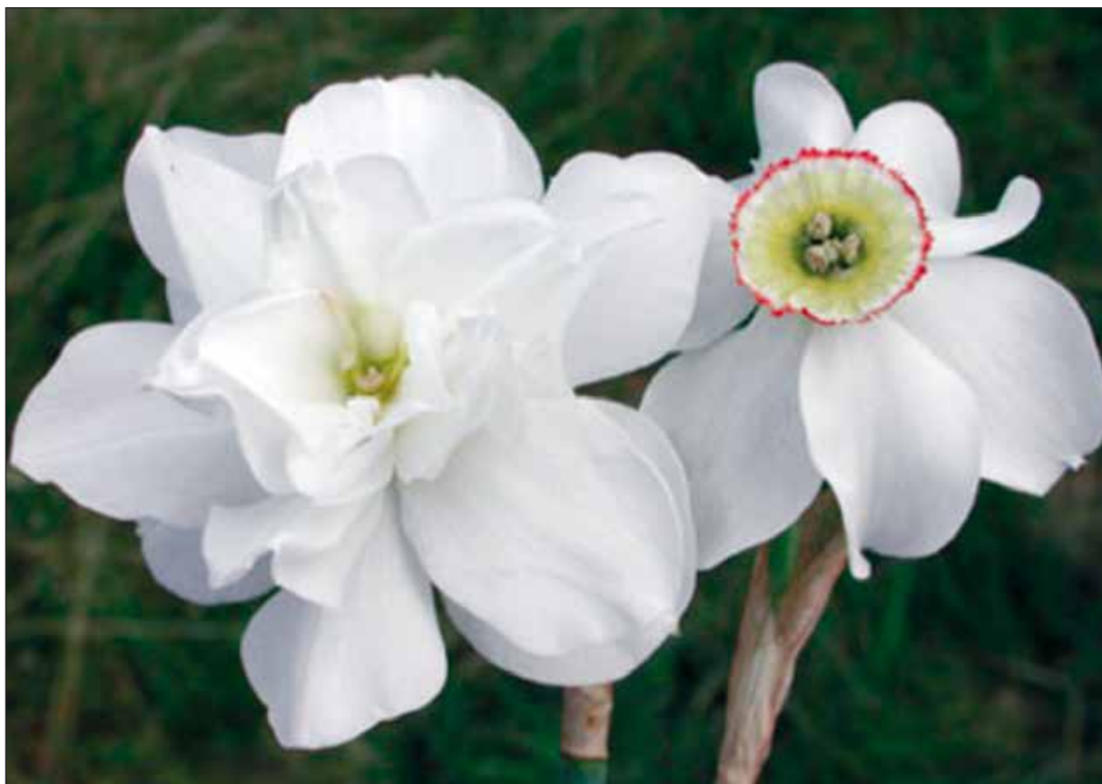
Fylt og enkel gammeldags pinselilje fra Ryvingen 04.06.2003.