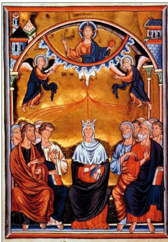
Illuminert manuskript som viser hvordan den hellige ånd kom til disiplene i pinsen. Den Hellige Ånd er fremstilt som ildstreker ned til apostlenes hoder.

Opprinnelig var pinsen en jødisk fest som markerte avslutningen på påsken og minnet om mottakelsen av de ti bud på Sinai, der Moses fikk lovens tavler. Men kirken har overtatt festen og gitt den sitt eget innhold - feiringen av Den Hellige Ånds komme til verden.