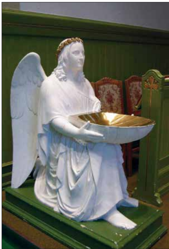
Dåpsengelen i Levanger kirke.