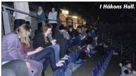
I Håkons Hall.

Det ble samla inn kr. 25.000,- som skal gå til en helseklinikk som HEKTA/KRAGERØ-prosjektene støtter. Etterpå var det festkveld med sang, video fra dagen, og taler. Kvelden ble avslutta som på fredag