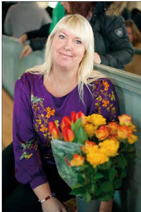
....og fra stab og samarbeidspartnere.