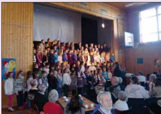
På Midtbygda oppvekstsenter inviterte elevane til fest.