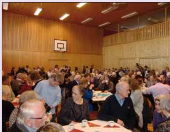
I kaffepausen gikk praten.