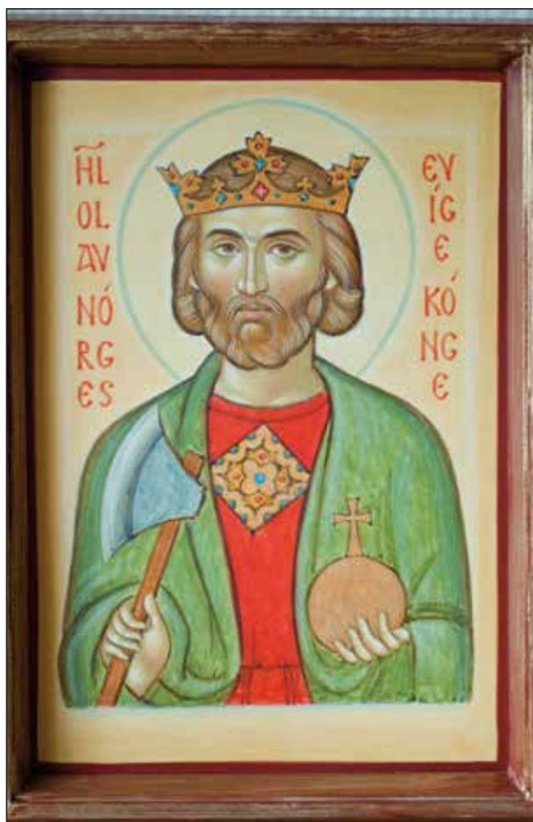
Ikon Hellig Olav

"Alle de som i dag har ikonmaling som yrke har utdanning. Noen går i lære hos en kjent ikonmaler, de har ofte en kunstutdanning fra før, andre tar utdanning spesielt i det å male ikoner. Ikonet er svært regelbundet, både i form og innhold. Det har et standardisert formspråk som bygger på autoriserte modeller. Ikonet har en forkynnende funksjon, og er en av flere måter kirken kommuniserer evangeliet på. Det framstiller visuelt det kirken lærer verbalt. Blant ortodokse kristne har ikonet også en naturlig funksjon som privat andaktsbilde. I russiske hjem er det vanlig å plassere husets ikon i det såkalte "vakre hjørnet" i oppholdsrommet