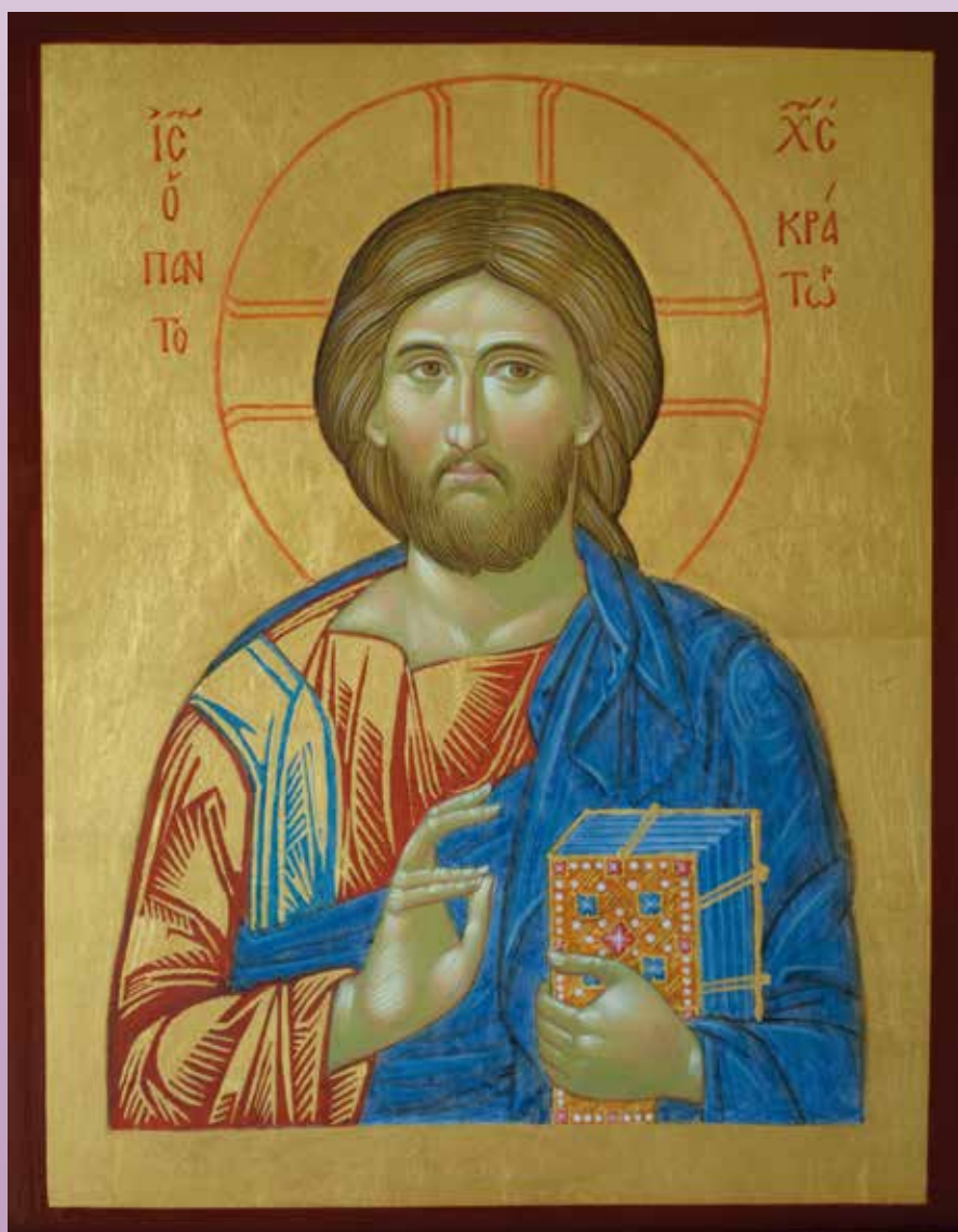
Jesus Kristus Pantocrator