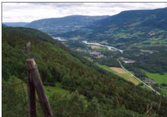
Sør-Fron, sett fra Skar.

Tekst og foto: Per Gunnar Hagelien. Pilegrimssenter, Dale-Gudbrands Gard