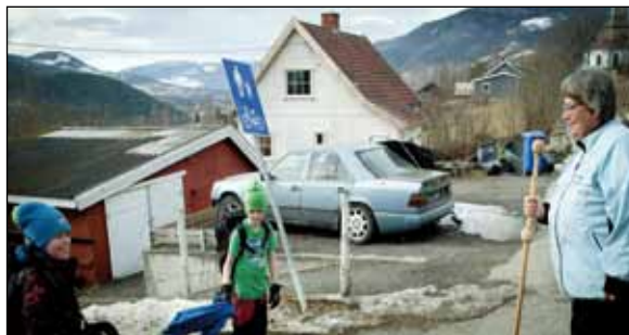
Et kort møte underveis.

Søndag 6. mars var siste visitasdag. Til vanlig kirketid var det visitasgudstjeneste i Sør-Fron kirke.