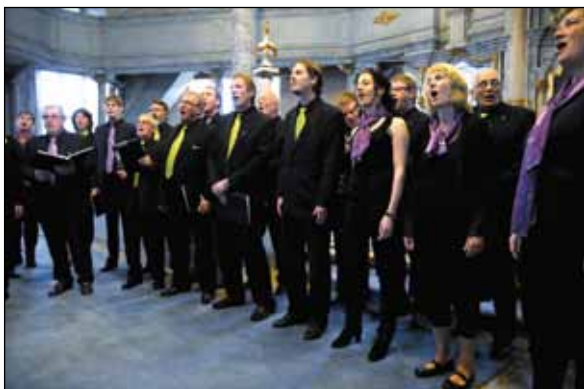
Tretten Sangkor.