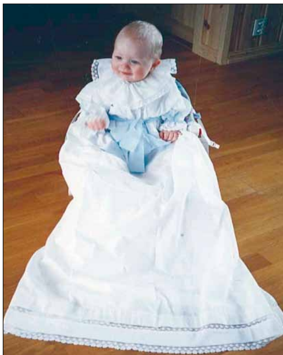
Her er dåpsbarnet i den flotte kjolen.