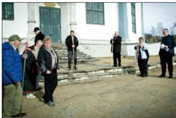
Klare for en liten pilegrimsvandring.