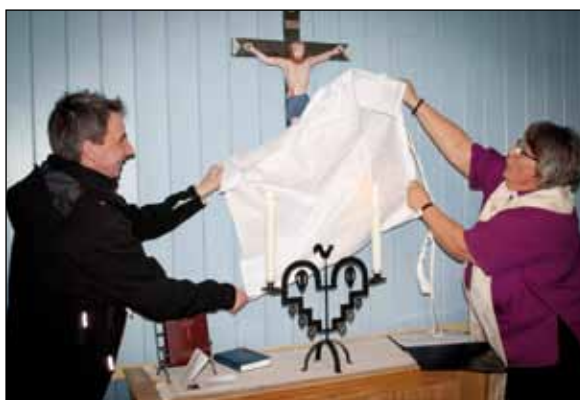
Avduking av krusifikset i pilegrimsrommet på Dale-Gudbrands gard.