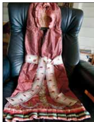
Dåpssvøp fra Jetlund.

På forhånd takk fra redaksjonen i Kyrkjebladet.