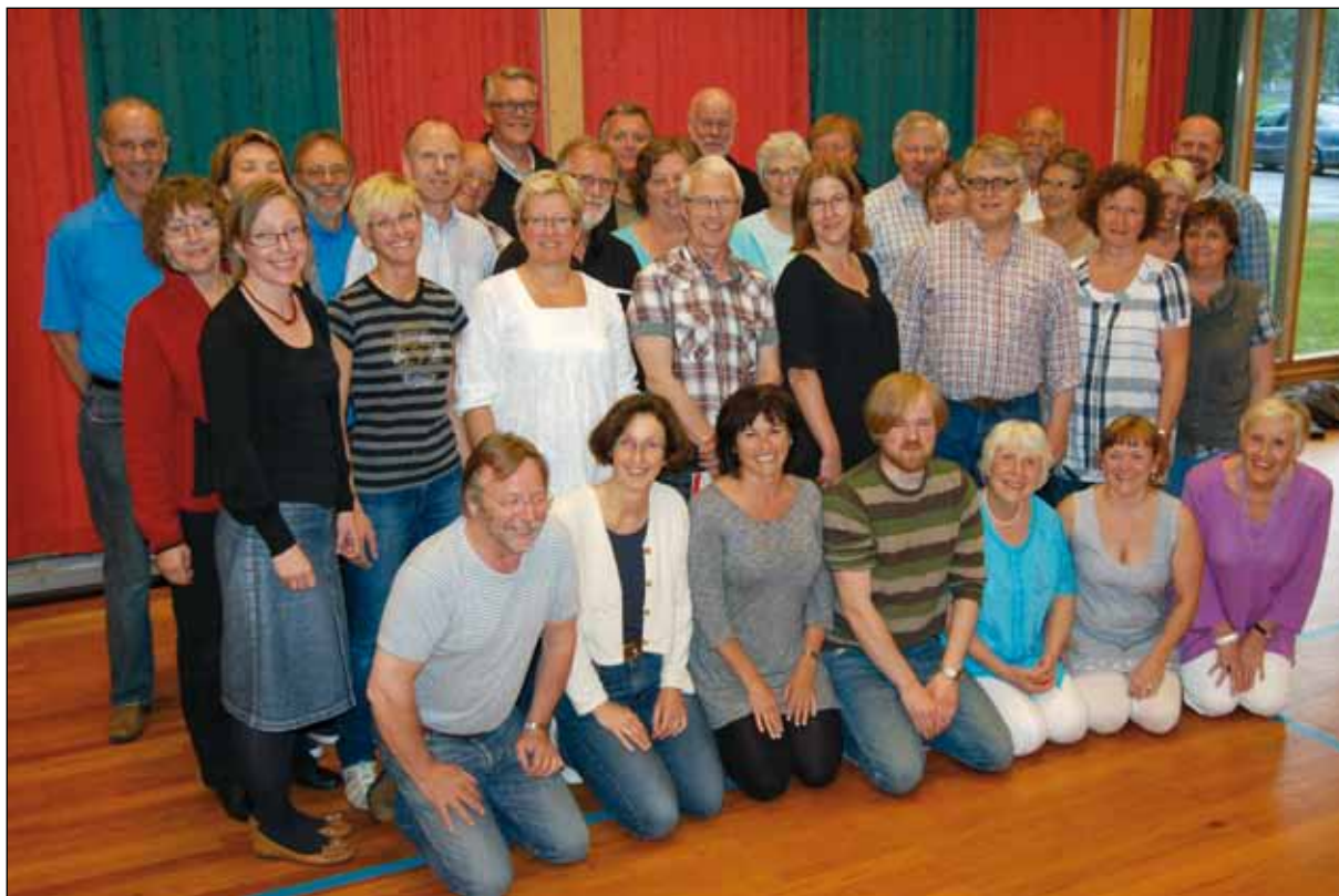
Sangere fra Dovrefjell Disharmoniske Selskab og Norsk Et Lite Kor skal framføre korverket Requiem av Gabriel Fauré i Dombås kirke 19. november og i Sør-Fron kirke søndag 20. november.