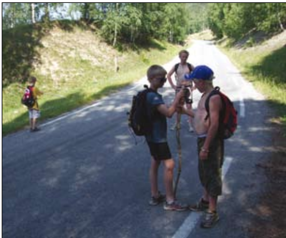
På vandring ovenfor Kjørstad.