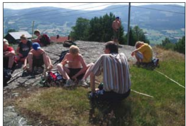
Mål: Skoe på Sødorp.