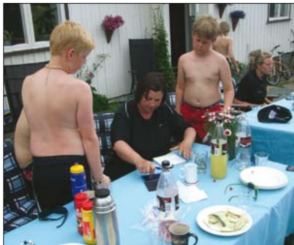
Mat og stempling på Listad.