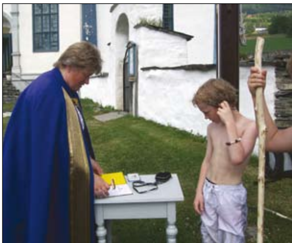
Passkontroll ved kirka.