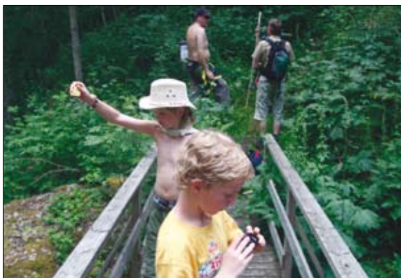
På vandring opp Augldalen.