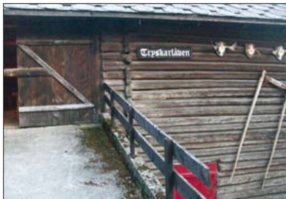
Tryskarlåven på Rudi, her sov vi.